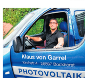
Interessant ist die Dienstleistung übrigens auch für private Hausbesitzer mit einer Solar- oder Photovoltaikanlage auf dem Dach. Denn Vater Staat fördert die Reinigung als haushaltsnahe Dienstleistung. Die Kosten sind somit steuerlich absetzbar.

„Paradiesen-Technik“ mineralisches Wasser und keine Chemie. „Wenn reines Wasser über die Oberflächen fließt, löst es alle vorhandenen Substanzen und hinterlässt nach gründlicher Spülung eine strahlende Oberfläche.“ Das hat physikalische Gründe. Ein Wasserstoffatom ist ein positiv geladenes Wasserstoffion. Das andere Atom ist gekoppelt ein das Sauerstoffatom und bildet so ein negativ geladenes Ion. Reines Wasser verbindet hingegen die Ionen und reingt somit die Flächen. Die Kosten der Reinigung sind nach Worten von Garrels überschaubar. Denn die Technik, die er einsetzt, ist äußerst effizient und zeitsparend.